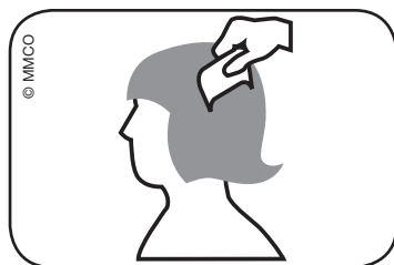
Abb. Durchkämmen des nassen Haares mit Lauskamm: vom Haaransatz bis zu den Haarspitzen